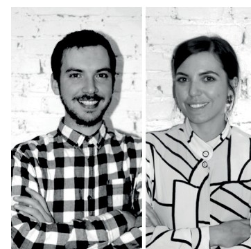
Studio Statuti Marco Statuti Ludovica Statuti

Testo - Mattia Mezzetti